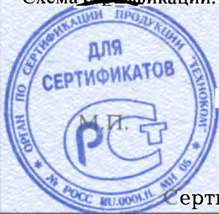
Схема сертификации: 3.