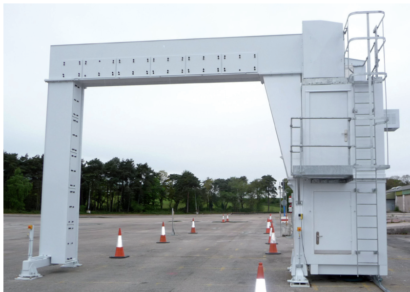
Система Rapiscan Eagle P60 на пункте досмотра при въезде и выезде.

Функция разделения материалов: помогает оператору выявлять обладающие низкой плотностью запрещенные предметы, например взрывчатые вещества и наркотики. Такие материалы с низкой плотностью на рентгеновском изображении выглядят иначе, чем материалы с высокой плотностью, например сталь. Для функции разделения материалов необходим генератор двухэнергетического рентгеновского излучения напряжением 6 МВ, которым оснащена система Rapiscan Eagle P60.