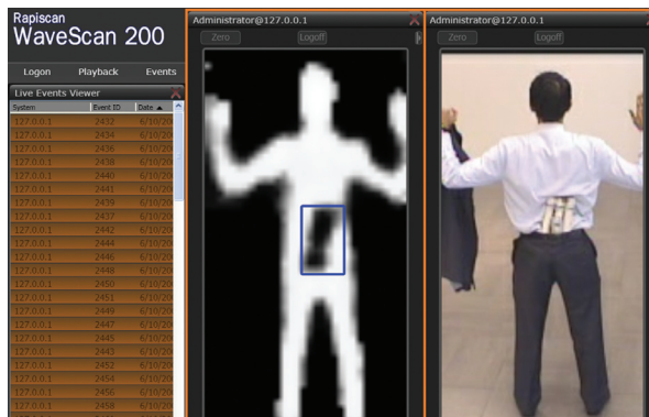
Отображение скрытого опасного предмета на изображении, полученном с помощью WaveScan.