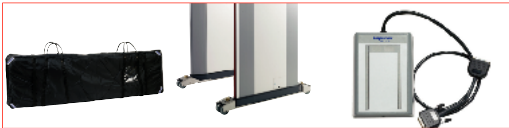
ЧЕХОЛ ДЛЯ ТРАНСПОРТИРОВКИ